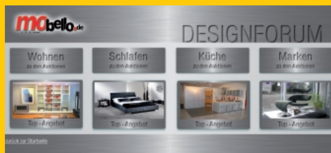
Ganz unten: Die Zahlen beweisen es: Bereits heute hat sich Mobello.de an der Spitze der Möbelanbieter im Internet etabliert. (Foto, Grafiken: Mobello)